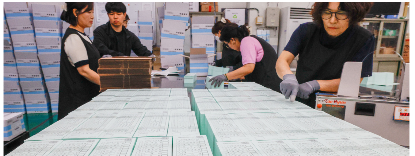
지방선거 투표용지 인쇄 시작 17일 오후 경기도 파주시 한 인쇄소에서 전국동시지방선거 투표용지가 제작되고 있다.